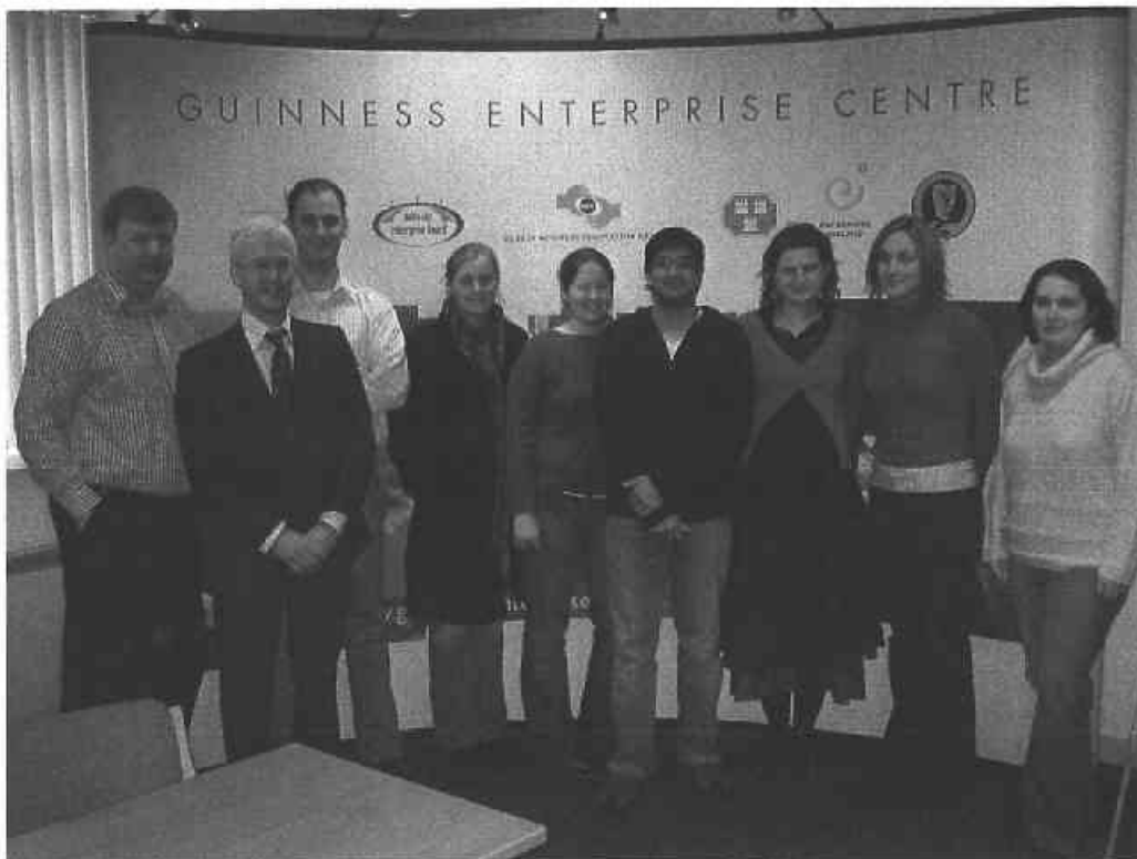
Rannpháirtigh sa Seimineár chun Smaointe Gnó a Ghiniúint in Ionad Fiontraíochta Mhic Aonghusa

Le linn 2004, dhein an Bord naoi seimineár lae a sheachadadh lenar díriodh ar na gnéithe go léir a bhaineann le fiontar nua a thosú agus a bhainistiú. D'fhreastail 140 fiontraí dóchasacha ar na seimineáir.