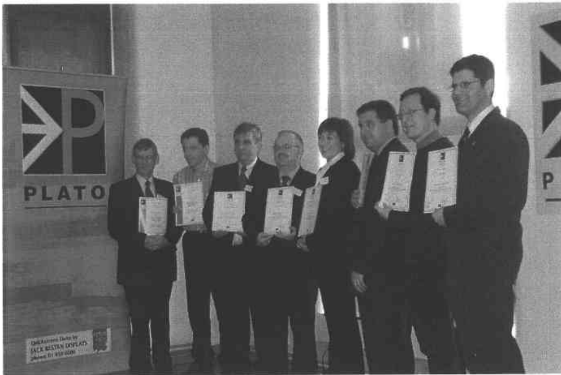
Céimithe de chuid Chlár Gréasáin Plato

Bhí rath ar an dá chlár sin i gcónaí sa bhliain 2004 agus, idir Plato Bhaile Átha Cliath Thuaidh agus Plato Chathair Átha Cliath agus Dhún Laoghaire / Ráth an Dúin, tá os cionn 180 mionghnólacht ag fáil diantacaíochta i gcúrsaí forbartha bainistíochta uainn agus ag baint leas as seimineáir gréasánaithe.