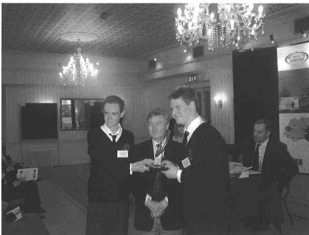
Buaiteoir Ghradam Mhairéad Uí Fhearghail – Coláiste Pháirc an Átha Ghainimh