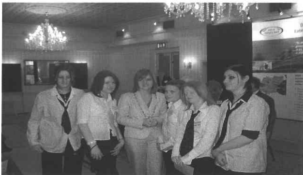
An Buaiteoir Sinsearach – Coláiste Alsandra