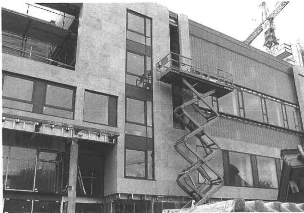
Tionscadal Chúinne na Saoirse, Sráid Sheáin Mhic Dhiarmada – Deontas Caipitiúil €200,000