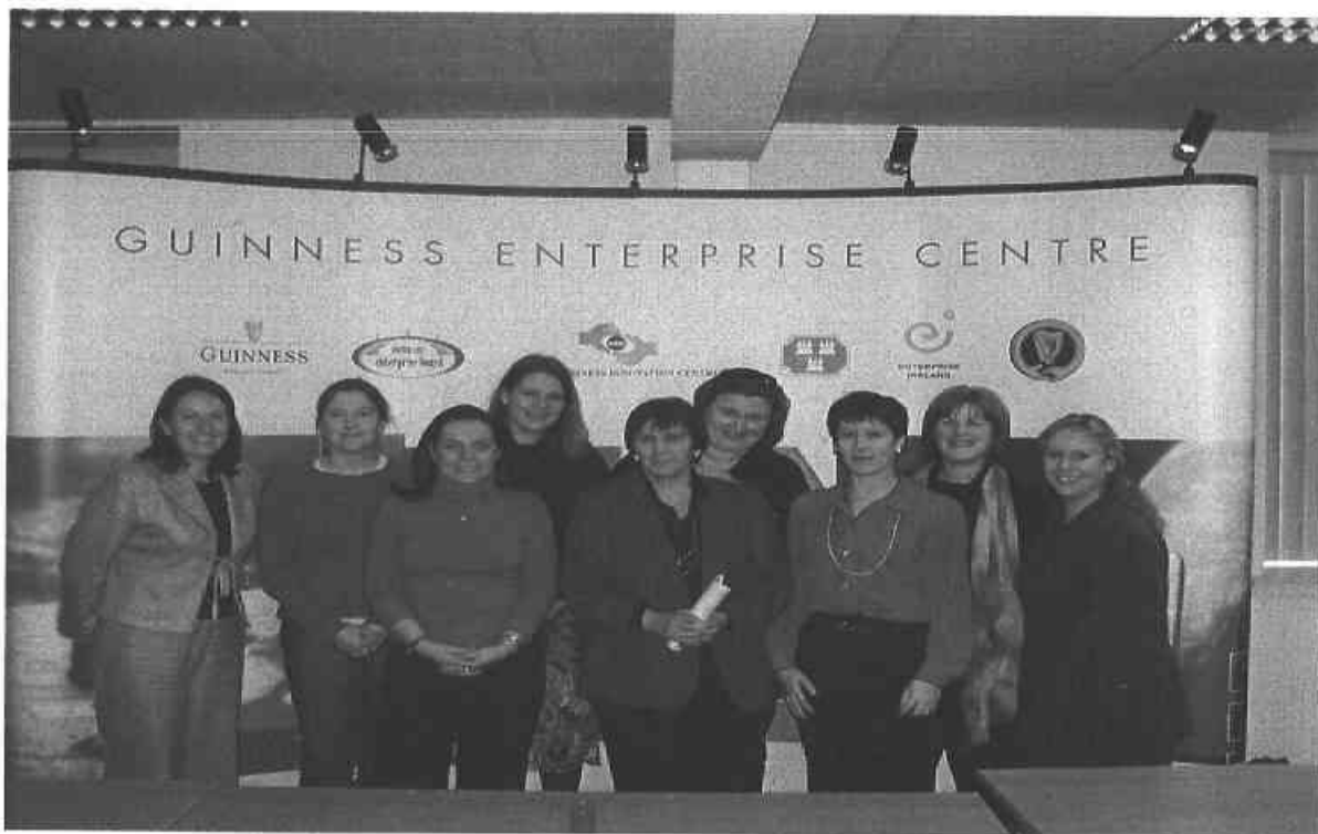
Rannpháirtigh sa Chlár um Mná ag Tosú i gCúrsaí Gnó

Ina theannta sin, le linn 2004, lean an Bord lena Ghréasán de Mhná i gCúrsaí Gnó agus d'fhreastail os cionn 40 bean ar na cruinnithe míosúla. D'eascair an tionscnamh seo as éileamh ag céimithe an Chláir Forbartha Gnó ar theastaigh uathu leanúint ar aghaidh lena bhforbairt ghairme tríd an gcleachtas is fearr a chomhroinnt agus tríd an ngréasúnú.