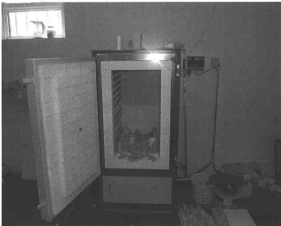
Alwyn Gillespie, Scoil Ealaíne Botanic – Deontas Caipitiúil €5,000